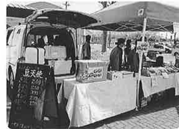
いらっしゃいませ～