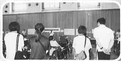
下越地区県身協オセロ交流会