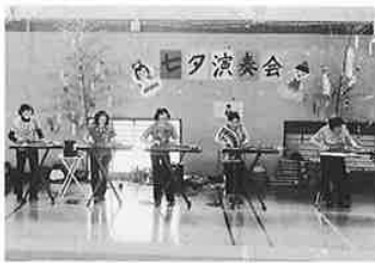
今年も素敵な演奏を ありがとうございました！

七月七日の七夕の日、みのり園ではアンサンブルQの皆さんをお招きし、大正琴の演奏会を行いました。