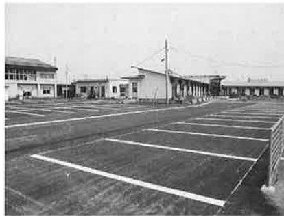
みのり園グラウンドに職員駐車場が 完成しました。