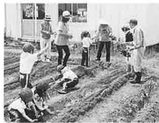
大きなさつまいもが 育ちますように！

五月二十四日、みのり園の畑にてみずほ保育園の皆さんと一緒に、さつまいもの苗植えを行いました。皆さんとても楽しまれました！