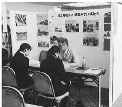
福祉の仕事ミニ面談会の様子

フェイスブック ⇒ 「新潟みずほ福祉会」 ホームページ ⇒ 「新潟みずほ福祉会」 www.nmf.jp で検索してください。