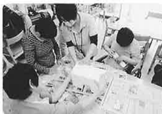
何ができるか乞うご期待！

八月二十六〜二十八日の西川まつりに向けて、傘ほこ保存会の協力をいただき子ども傘ほこを作成しています。