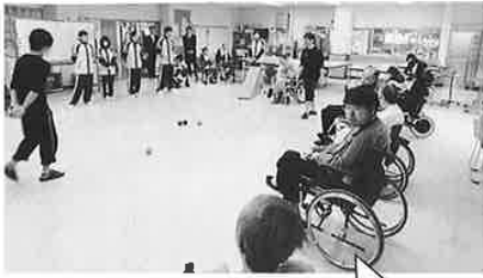
新潟医療福祉カレッジの学生のみなさんにボランティアに来ていただき、一緒にポッチャを楽しみました♪♪