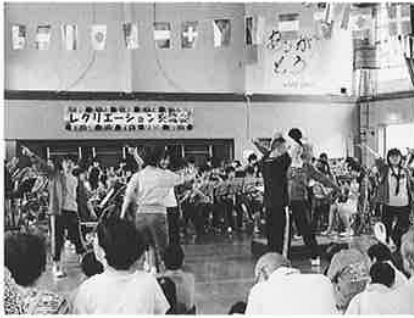
演奏に合わせてダンス！ダンス！ とても楽しい演奏会でした！

午後からの吹奏楽の演奏会では7曲演奏していただきました。特にリクエストしていた「恋するフォーチュンクッキー」では利用者さんも前に出て踊り、とても楽しい演奏会になりました。