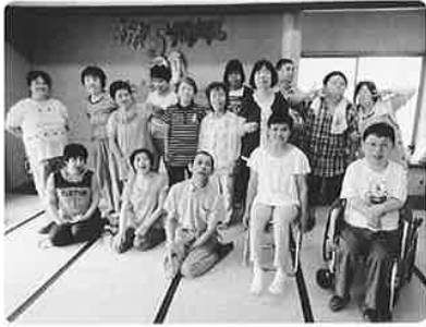
感謝の気持ちを忘れずに、これからも笑顔で頑張ります！

七月五日に西川コミュニティセンターにて五周年記念昼食会を開催しました。当日は日頃お世話になっている方々をお招きし、美味しいお弁当を食べながら思い出話に花を咲かせたり、素敵な楽器演奏やマジックを楽しみました。利用者の方皆さんも練習を重ねてきたハンドベルで「見上げてごらん夜の星を」と「さらさら星」を演奏し会場を盛り上げました。