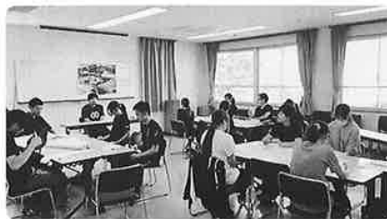
新人育成のための研修風景

新潟みずほ福祉会ではフェイスブックを中心としたブログを公開しています。その一部を毎回、広報誌に載せていきます。